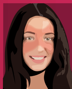
Érythème en ailes de papillon

Actuellement, le lupus n'est pas guérissable. Selon les organes touchés, il peut être bénin, grave ou fatal.