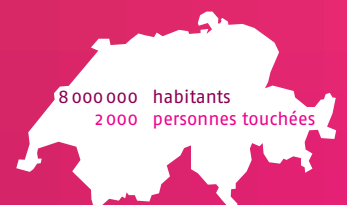
Prévalence en Suisse (estimation)