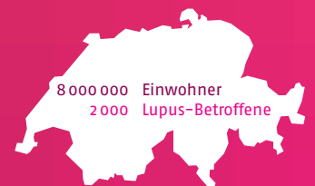
Betroffene in der Schweiz (geschätzt)